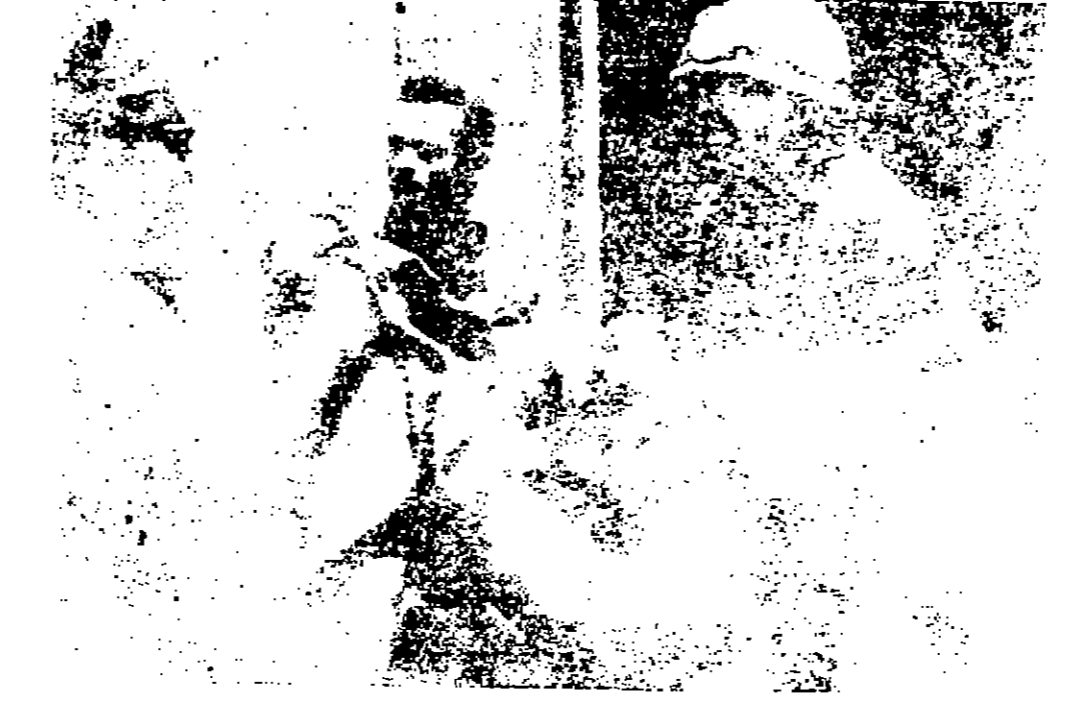
جنود الاحتلال الاسرائيلي يحملون احد الجرحى الاسرائيليين المحن الذين اسغر عنهم الاحتفال الذي وقع داخل الحرم الابراهيمي الشريف في الخليل اثناء صلاة اليهود